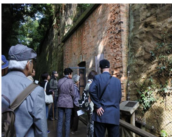
フランス積みの煉瓦造りの弾薬庫前