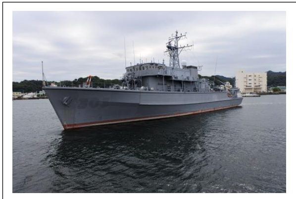
木造の自衛艦（廃船）

昼食後、 猿島 に 13 時 30 分の船で渡り 15 時 45 分の船で帰ってきました。