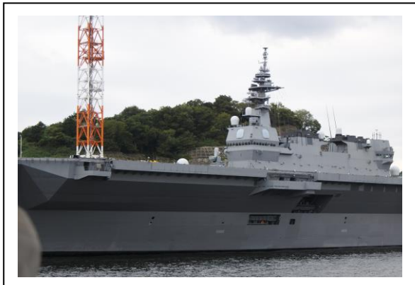
ヘリコプター艦載艦