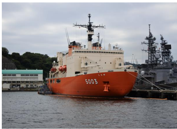
南極観測船、砕氷艦「しらせ」