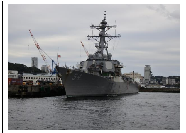
海上自衛隊イージス艦

自衛艦のイージス艦、南極船「しらせ」ヘリコプター艦載艦、潜水艦などが停泊していました。残念ながらアメリカの空母は日本海に出港していませんでした。