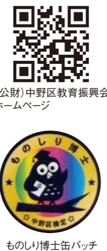
ものしり博士缶バッジ

誕生しました。ものしり博士認定贈呈式は平成30年1月12日(金)午後4時より中野区役所にて行います。第4回中野区検定の「問題」と「解答」については中野区教育振興会ホームページ( http://nakanoku-eps.or.jp/ )から見る事ができます。